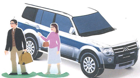
ペーパークラフト完成図